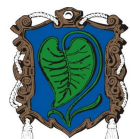
Městský úřad Heřmanův Městec